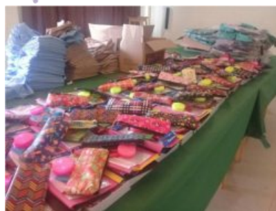
Sacs d'école à remplir ...