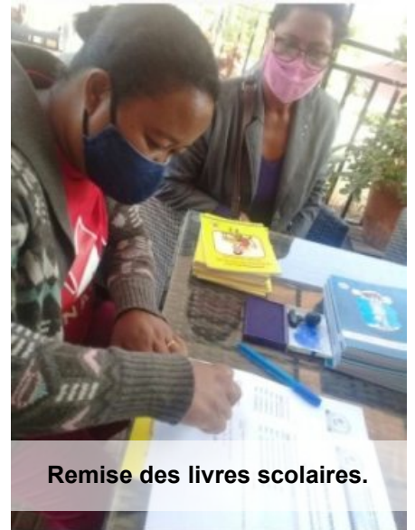
Remise des livres scolaires.

La directrice et les enseignants vous adressent leurs plus vifs remerciements.