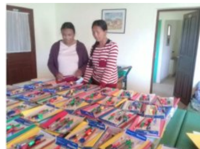
... Avec des fournitures scolaires !